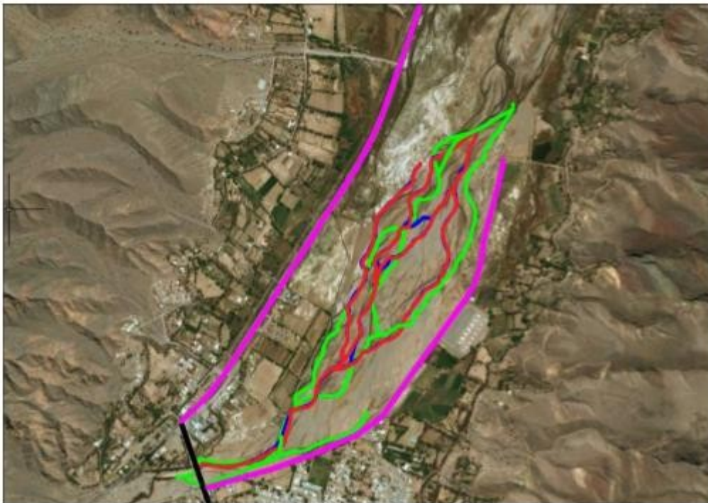
Figura 16.- Vías de escurrimiento para diferentes años sobre el Río Grande

Las obras propuestas que surgen del estudio de referencia basado en estudios básicos, Hidrología de Superficie, determinación de cuencas de aporte, Datos pluviométricos que permitieron el procedimiento de cálculo para la determinación de los caudales de diseño y el grado de movilidad del río grande para el tramo comprendido priorizado para la futura intervención del Parque Lineal Margen Izquierda y Zona servicios y Urbanización Margen Derecha. Esto debió ser analizado como movilidad Fluvial.